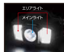
近くをワイドに照射するエリアライト